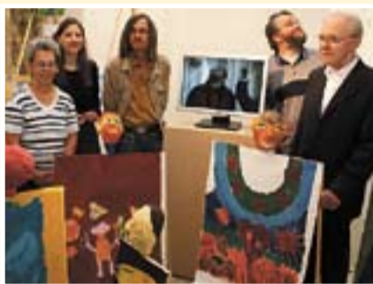
Kunst im Kreuzgang ist derzeit in der Nikolauskapelle zu sehen.

In ihren Arbeiten setzen die Teilnehmer Eindrücke von Skulpturen des Diözesanmuseums um. Ein Video, auf dem der Arbeitsprozess des Projekts dokumentiert wird, bildet das Kernstück der Installation. Zusätzlich regt die Anfertigung von Gemälden die Teilnehmer dazu an, ihren Glauben und ihre Einstellung zum Leben zu reflektieren. In der Installation solle zum Ausdruck