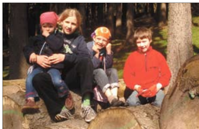
Cousinentreffen mit Cousin im Thüringer Wald: Kinder aus den neuen und alten Bundesländern brauchen kein Visum, um sich zu sehen.

Ob auf Phoenix oder ARTE: Immer, wenn im Fernsehen Dokumentationen über die letzten Tage der DDR, über die Maueröffnung und die Wendezeit laufen, rufen wir zu Hause auch die Kinder vor den Fernseher: „Kommt her, da wird etwas über die DDR gezeigt.“ Denn die verschiedenen Zeitzeugenberichte können wie Mosaiksteinchen helfen, sich ein Bild von der DDR zu machen, und das finde ich wichtig. Unsere Kinder sollen etwas erfahren über die geschichtlichen Ereignisse, denen sie ihre Existenz verdanken: Ohne die Grenzöffnung 1989 hätte ich nach dem Studium nicht drei Jahre in Thüringen