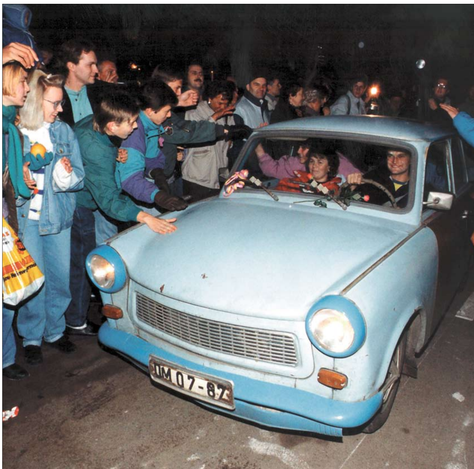
Die kleinen „Stinker“ werden freudig begrüßt: Noch in der Nacht des 9. November 1989 rollen Ostberliner mit ihren Trabbi über die Grenze.

Freitag, 10. November 1989. Mit einem Studienfreund war ich aus dem Emsland unterwegs nach Duderstadt. Wir wollten dort einen weiteren Studienfreund besuchen und am traditionellen Gansessen teilnehmen. Am 9. November hatten wir natürlich die sensationellen Bilder aus