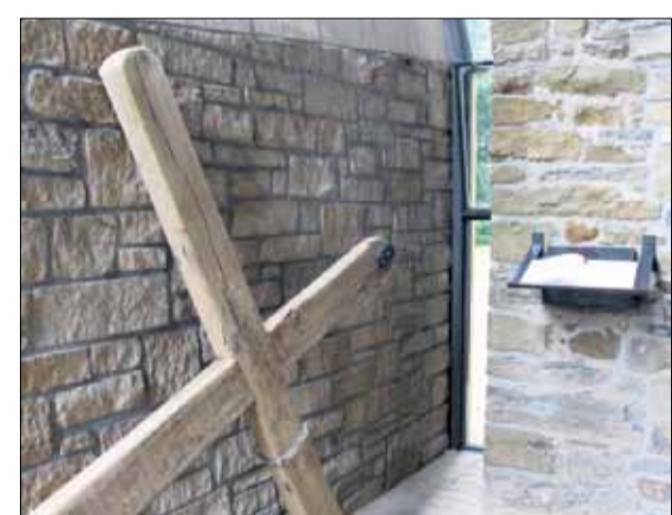
Das schlichte Ersatzkreuz wird bei Regen verwendet. In der „Kapelle des Lichts“ liegt auch das Fürbittbuch.

zu beten, oder um für jemanden das Kreuz zu tragen. Sie kommen auch, um Danke zu sagen nach einer überstandenen Krankheit. Die Leute schätzen die Atmosphäre des stillen Ortes und die Natur. Viele kommen regelmäßig nach Lage, „eine Frau ist offenbar Krankenschwester und legt jeden Freitag im Fürbittbuch ihr Leid ab“, sagt Holz.