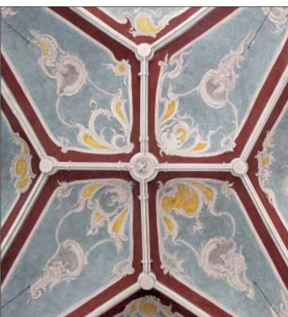
Die spätgotische Wallfahrtskirche St. Johannes der Täufer enthält viele barocke Elemente im Innern.