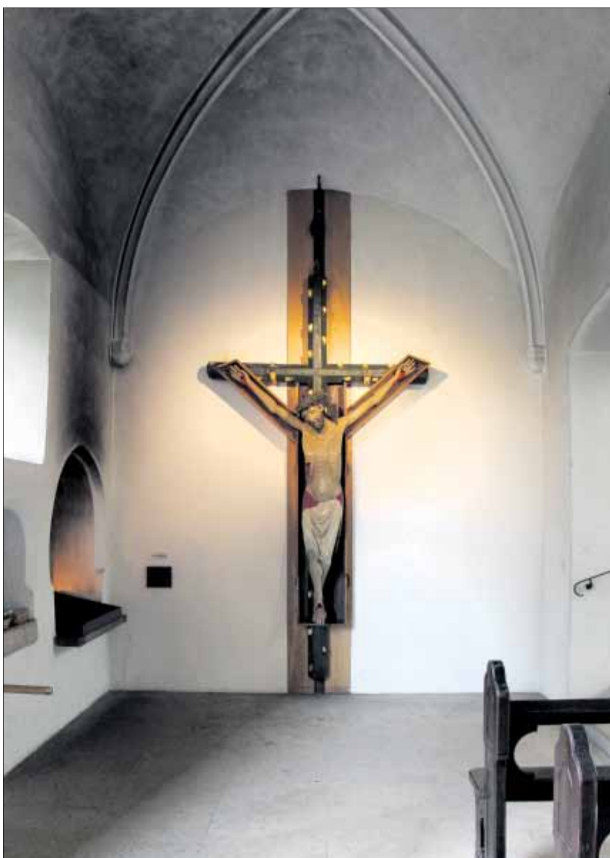
Das leidende Kreuz zieht seit Jahrhunderten Pilger an. Nach mehreren Ortswechseln innerhalb der Wallfahrtskirche befindet es sich nun in der 2001 eigenen gebauten „Kapelle des Lichts“.

Über das ganze Jahr verteilt kommen Christen an diesen Ort, um das Lager Kreuz, auch bekannt als das „Wunderbringende Kreuz“, zu berühren oder zu tragen. Dieser Brauch ist inzwischen 700 Jahre alt und geht auf zwei Johanniter zurück, die im Ordenskreuz in Lage lebten. Ritter Rudolf und der Priester Johannes empfingen der Legende nach im Jahr 1300 eine Vision Jesu am Kreuzberg, in der sie beauftragt wurden, ein Kreuz zu errichten: „und alle, welche sich in Bedrängnis befinden, sollen hier Gnade finden“. Bei dem Kreuz handelt es sich um ein crucifixus